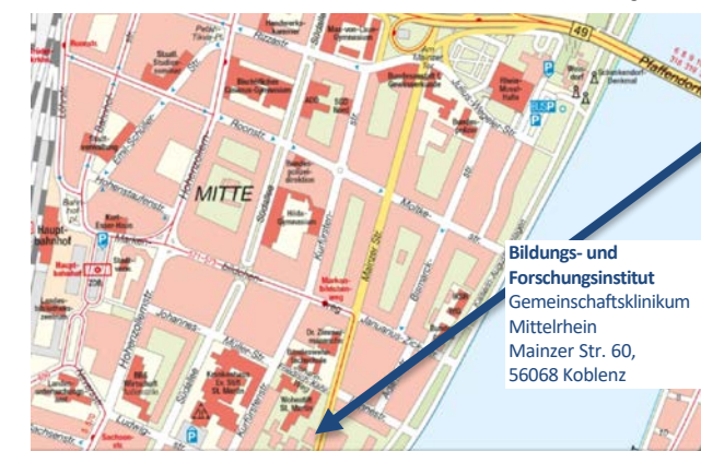
Bildungs- und Forschungsinstitut Gemeinschaftsklinikum Mittelrhein Mainzer Str. 60, 56068 Koblenz